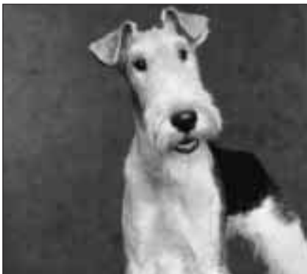
Många hundägare upplever att deras hundar har en särpräglad doft.