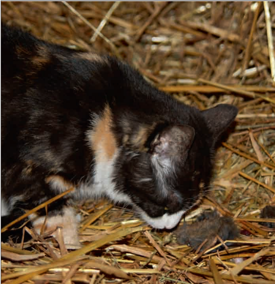
Intakta kattmödrar med ungar är mycket effektivare jägare än alla andra kategorier av katter, men även kastrede katter jagar och tar med sig sina byten hem.

ning av ägarna till 42 vuxna hankatter visade det sig att 80-90 procent av katterna slutade urinmarkera, slåss med andra katter och att ströva iväg efter att de hade kastredats. Ungefär hälften av de katter som var benägna att slåss förändrade sitt beteende så snart som en till två veckor efter kastredning, medan den andra hälften slutade mera gradvis. Samma förhållande gällde även problem med att katterna strövade runt. De flesta katterna i studien slutade enligt ägarna också snabbt att urinmarkera efter kastredningen, men sannolikt fortsatte beteendet till viss del utan att det upptäcktes av ägaren. När katten hade haft fler än ett problembeteende kunde den ha slutat med ett av beteendena (till exempel att urinmarkera) efter kastredningen, men fortsatt visa resterande beteenden. Utöver dessa beteendeförändringar uppgav en fjärdedel av ägarna att katterna blivit mera lätthanterliga och fogliga.