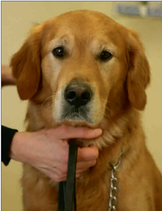
En valp som utfodras korrekt kan få leva ett långt, hälsosamt liv.

Hedhammar, Å. 1996. Chapter twenty. Nutrition Related Orthopaedic Diseases. In: Kel-