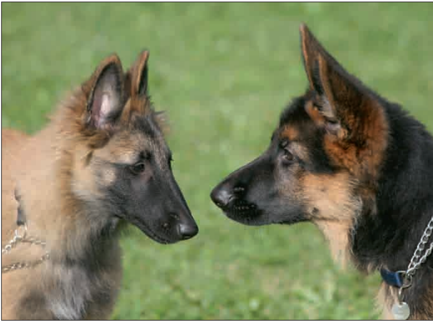
Herpesvirus smittar när hundar har noskontakt.