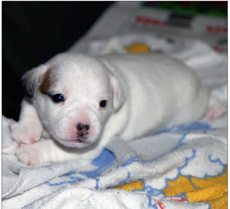
Den unga valpen kan inte reglera kroppstemperaturen. Herpesvirus kan därför spridas i valpens kropp.

Man har funnit Leishmania i sperma, så parning är en tänkbar smittväg. Sannolikt är den smittvägen dock mindre viktig än via fjärilsmyggor – åtminstone i områden där fjärilsmyggan finns, i bland annat Spanien och Italien.